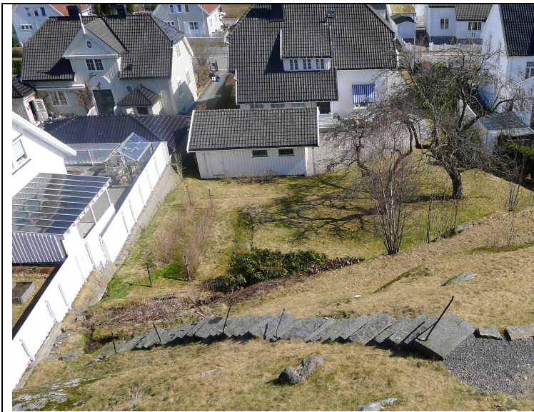
Reistar av «de 72», dvs. dei 72 trappetrinna mellom huset og eplehagen, som grensa til køyrevegen. Den store eplehagen er borte, vegen flytta og området er fortetta i fleire vendingar. Foto: E. Almhjell, 2018

Olav skriv brev frå Mandal 14. april og får svar frå Karin 19. april 1911.