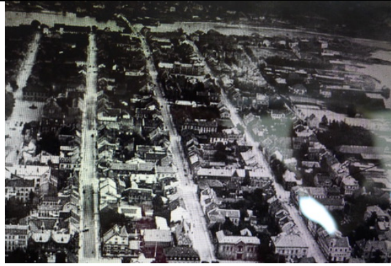
Delar av kvadraturen i Kristiansand.